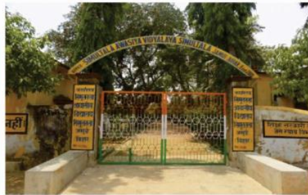
सिमूलतला आवासीय विद्यालय के प्रारंभिक परीक्षा में 624 बच्चे सफल हुए हैं। सफल होने वाली में जमुई जिले के छात्रों की संख्या काफी ज्यादा है। एक ही विद्यालय के 30 बच्चों को मिली सफलता। सिमूलतला आवासीय विद्यालय प्रवेश परीक्षा परीक्षाम से राजकमल प्रबंधन सफलता।